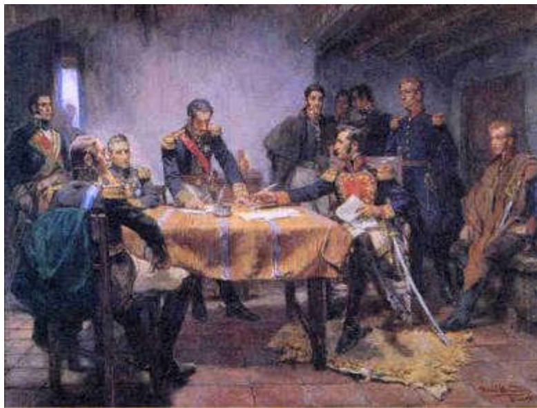
El Mariscal Antonio José de Sucre (sentado a la derecha) en la firma de la Capitulación de Ayacucho en 1824.